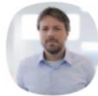
Remco van Toor Techniek